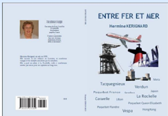
ENTRE FER ET MER

(Trousse-Chemise et galettes de l'île de Ré seront offerts par les deux auteurs)